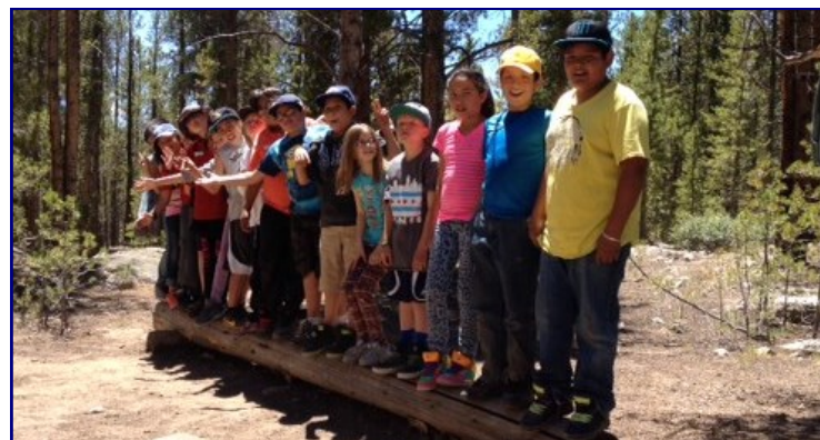
Rockies Rock! Los estudiantes visitan Outward Bound.